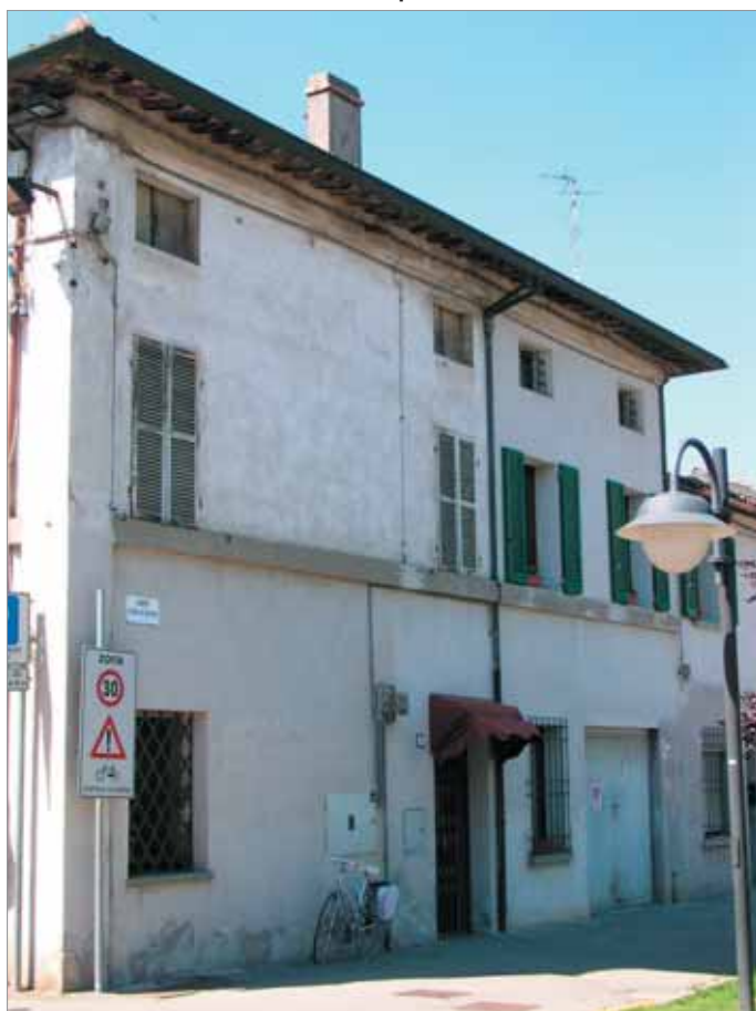
Largo de Gasperi 1; 2 Fronte Principale